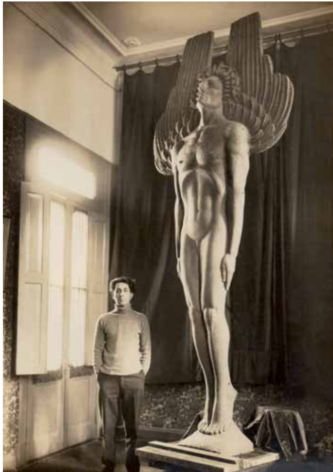
Imagen 2. El errabundo , s/d. Bronce 42,5 x 28 x 26,5 cm.